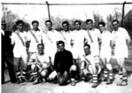
Le FC Chippis en 1938