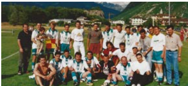
Le FC Chippis en 1998, avec la promotion de la première équipe en 3 ème ligue. Depuis cette année le FC Chippis n'a plus évolué en 4 ème ligue.

La saison 2016 – 2017 est historique pour le club, avec le titre de champion de 2 ème ligue, la victoire en coupe Valaisanne et la première place au classement Fair-Play. Le 13 août 2017, le FC Chippis accueille le FC Zürich en présence de 2000 spectateurs, dans le cadre des 32 ème de finale de la coupe Suisse. Défaite 10 à 0 mais magnifique journée de fête pour la venue de cette équipe de Super League.